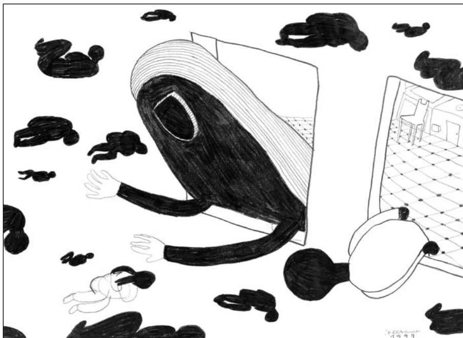
Erramun Mendibelanda: Udaberria hilabeterik krudelena (1999). Grafitoa.

Aurreko eskena gertatzen den leku berean (eskaratzean), Amumak Mundua zertan den irakasten dio bere ilobari. Inguruan, uholde baten jario bortitzean, gizonezkoen siluetak etzanda doaz (alienatuta) eta Unibertsoa dena guztiz okupatzen dute. Kanpoaldea mugarik eta erreferentziarik gabeko espazioa da, bertan maskulinoa eta aspergarria den errealitate bat nagusitzen dela. Ikusten ditugun lehiak kobazuloan zabaldutako begiralekuak dira. Hantxe, gure umeak bizitzak duen zentzu Magikoa ezagutzen du lehenengoz. Amumak diotso: etxeko eskaratzetik irteten zarenean, umea, tentelduko zaituen bizitza izango duzu.